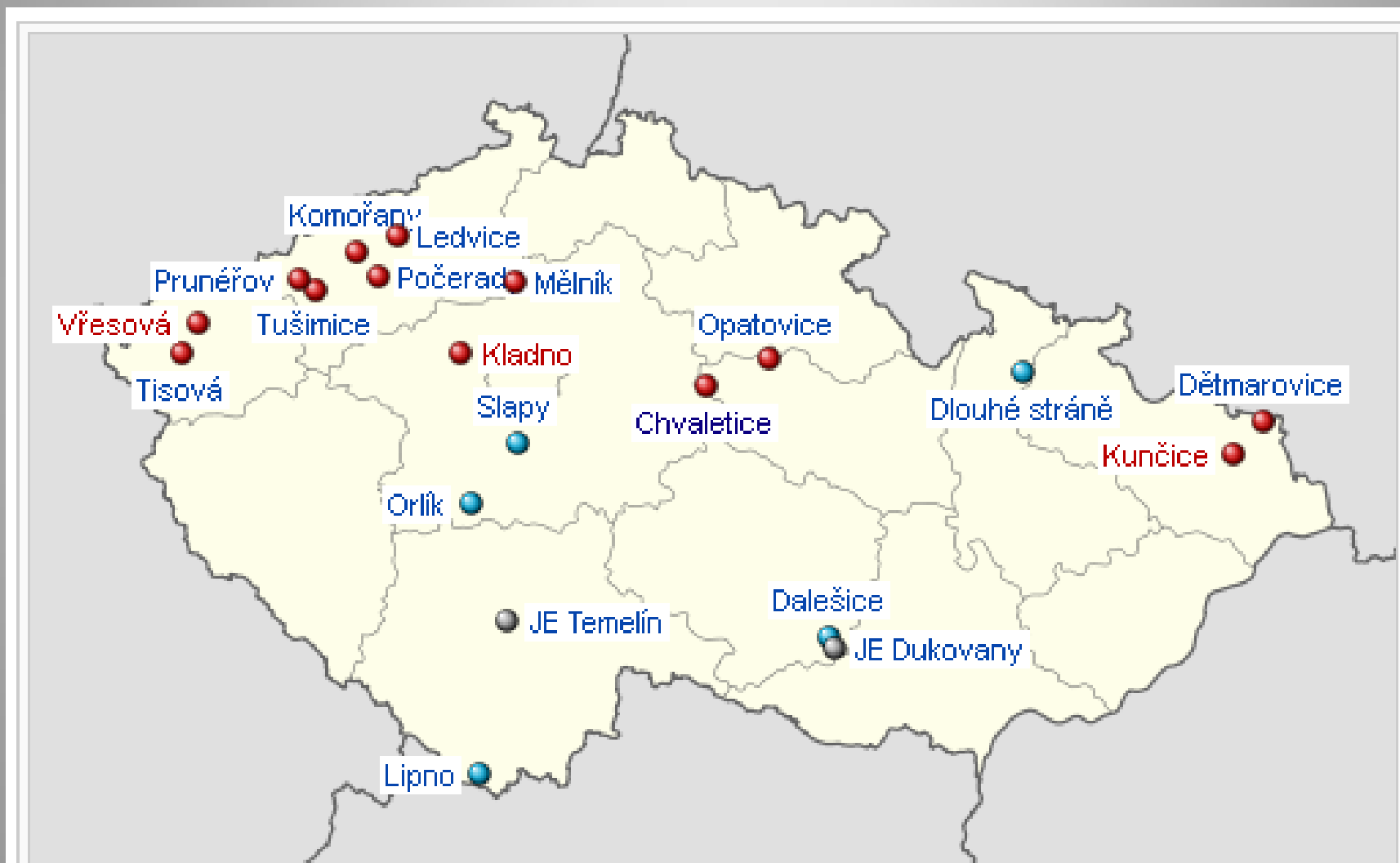
Největší elektrárny v Česku